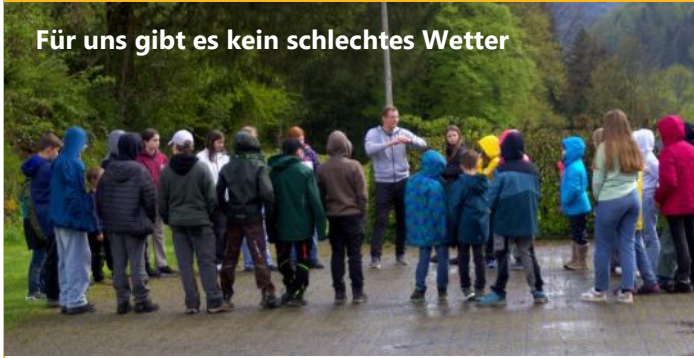
Für uns gibt es kein schlechtes Wetter