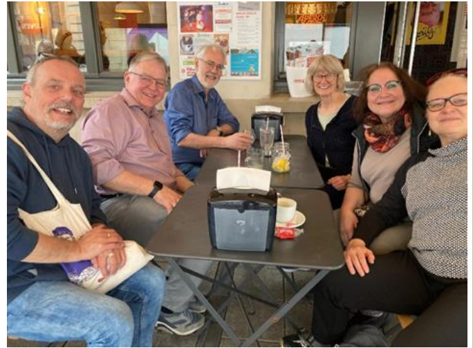
In einem Straßencafé in Straßburg

Auch eine gemütliche Einkehr zum Kaffeetrinken durfte nicht fehlen.