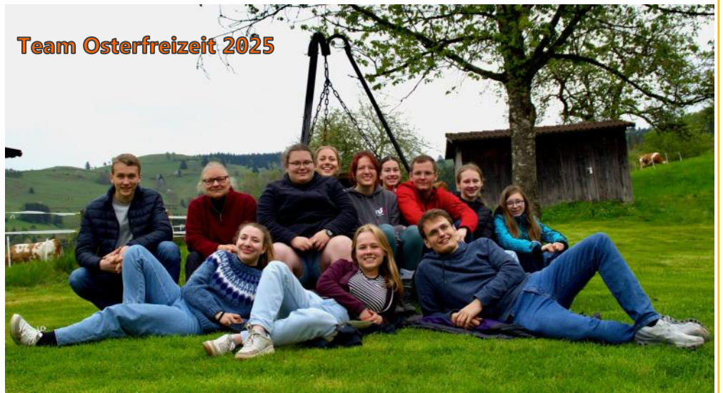
Team Osterfreizeit 2025