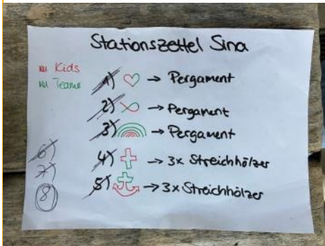
Geheimnisvolle Zeichen von den JuMikas für die Rallye entwickelt