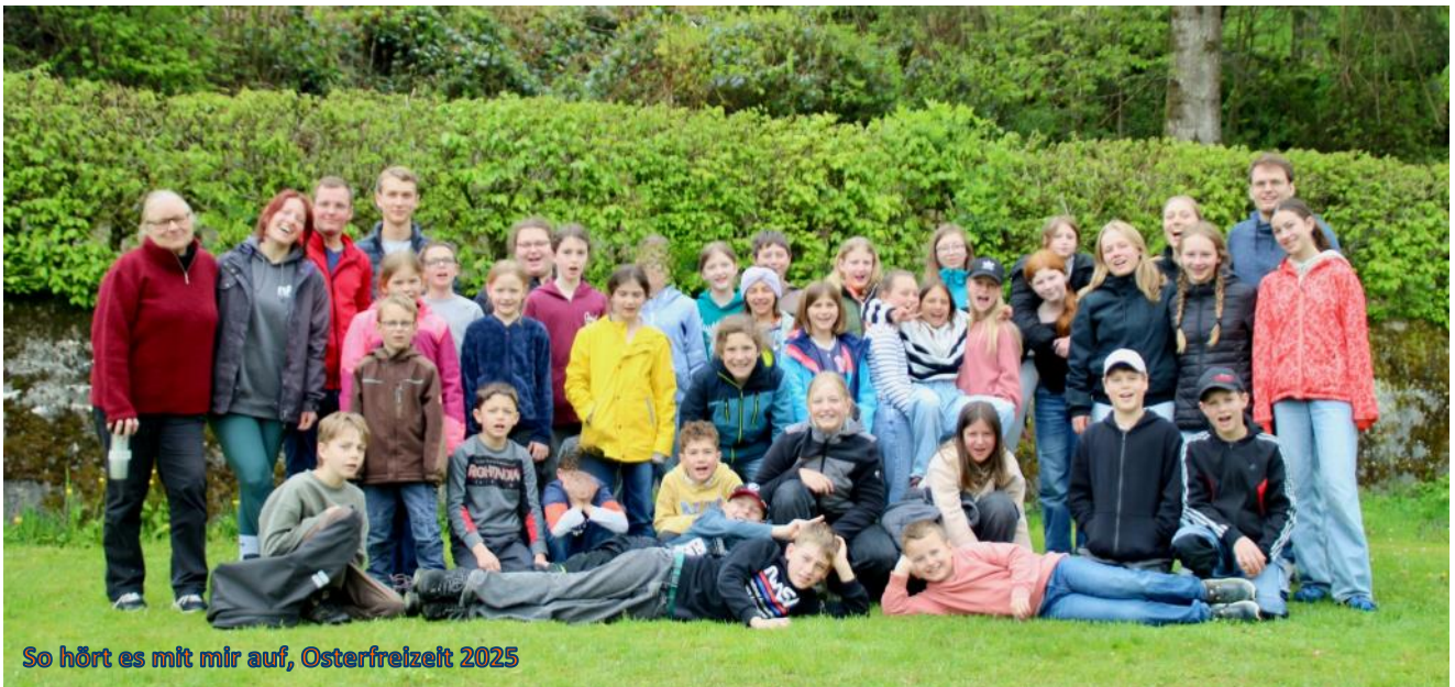
So hört es mit mir auf, Osterfreizeit 2025