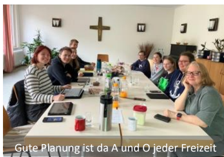
Gute Planung ist da A und O jeder Freizeit