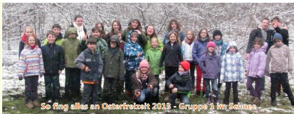
So fing alles an Osterfreizeit 2013 - Gruppe 1 im Schnee

Komm, sag es allen weiter Unsere Osterfreizeit mit Paulus