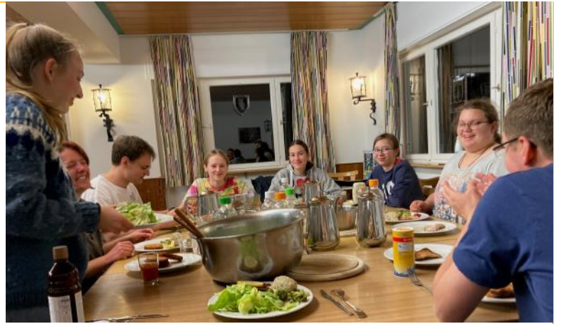
Ja, Kochen können sie, die JuMikas Gutes Essen für alle war uns immer wichtig